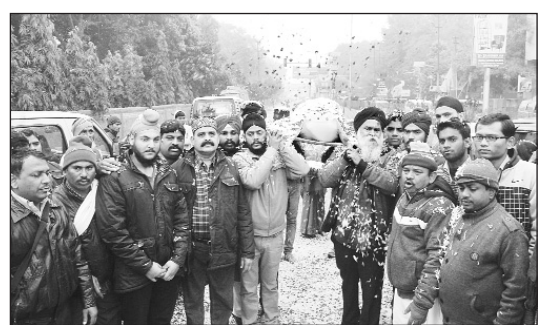
लावारिस शव को कंधादान देते सामाजिक सेवा समिति के पदाधिकारी।

सीओ कोतवाली ने बताया कि मतदाता को मतदान के लिए जागरूक करने और निडर होकर इसमें हिस्सा लेने का संदेश देने के लिए एडीएम सिटी, सीओ कोतवाली और सीओ कलक्टरगंज ने संवेदनशील और अतिसंवेदनशील क्षेत्रों में रूट मार्च किया। भारी पुलिस बल और पैरा