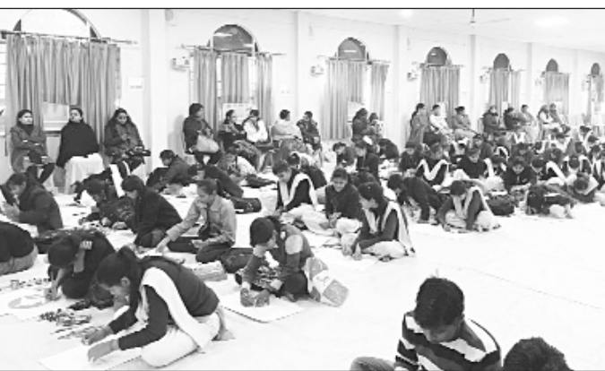
बीएसएसडी कालेज में आयोजित प्रतियोगिता में भाग लेते छात्र-छात्राएं।

पहली जनवरी को अठारह वर्ष के हुए छात्र-छात्राओं और नव युवाओं को मतदाता बनाने के लिये भारत निर्वाचन आयोग ने अठारह पंद्रह से सत्रह आयु वर्ग के विद्यार्थियों को अभी से मतदाता बनने के लिये प्रेरित करने के आदेश दिये हैं, ताकि वह अभी से मतदाता बनने के लिये जागरूक हो जायें और 18 वर्ष के होने पर स्वयं मतदाता बनने की पहल करें। आयोग के आदेशों के अनुपालन में जिला स्तर पर ऐसे बच्चों के लिये पेंटिंग प्रतियोगिता कराने का फैसला किया है। बीएसएसडी शिक्षा निकेतन में रविवार को प्रतियोगिता का आयोजन किया गया। प्रतियोगिता का विषय 'एवरी वोट काउंट्स' यानी प्रत्येक वोट जरूरी है रखा गया था। जिले भर के स्कूली बच्चों के लिये