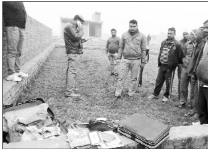
स्क्रेप व्यापारी के घर से लूटे गये सूटकेस कुछ दूर खाली प्लॉट में पड़े मिले।